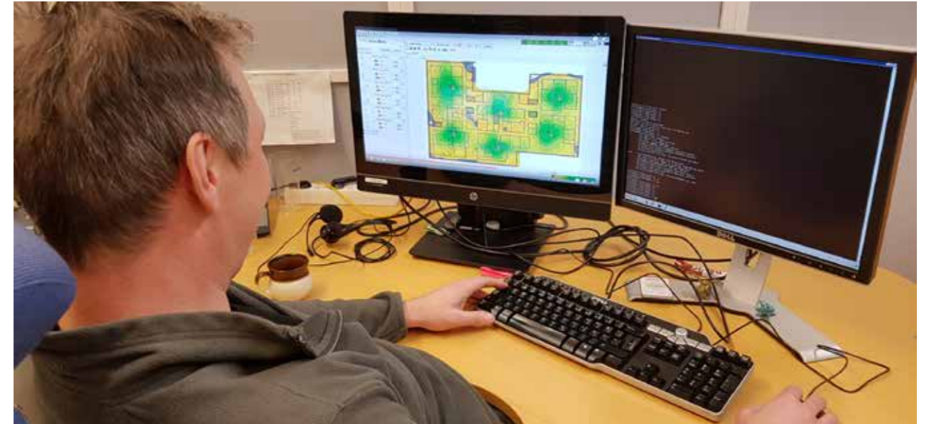
Site survey käynnissä.